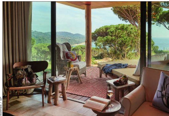
Tezenas / SP