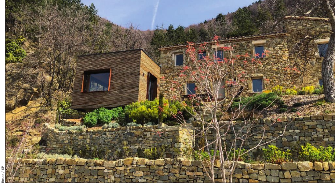
Besse / SP